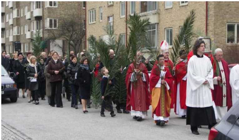
Palmsöndagen med Nuntien