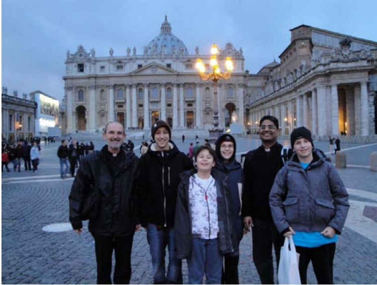
f. Alviero och f. Samji tog med sig ministranterna och åkte iväg till Rom