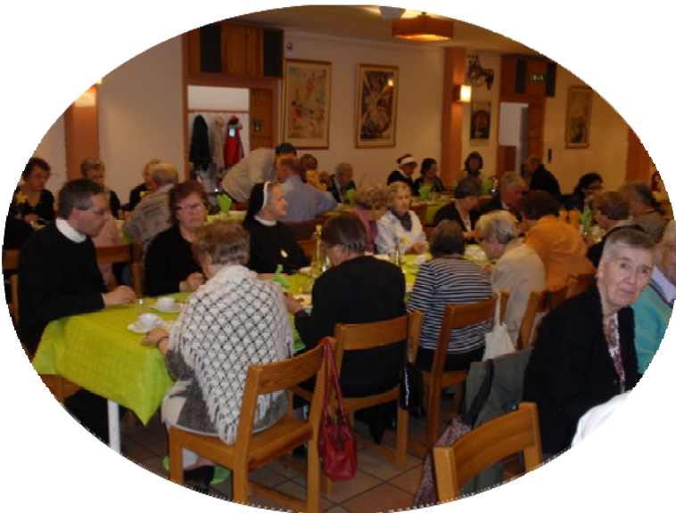
De äldres fest