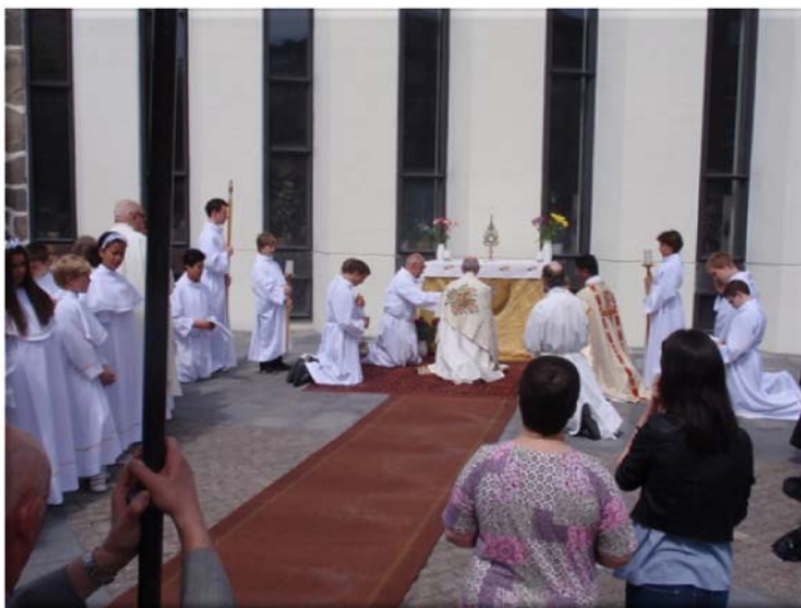
Kristi Kropps och Blods högtid